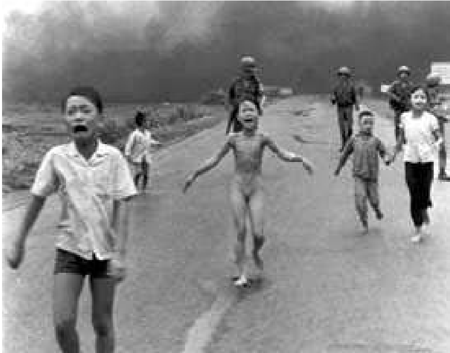
"Niños escapando de las bombas de napalm" Huynh Cong, Tran Bang, Vietnam, 1972

Las quemaduras debidas al napalm son mucho más graves que las comunes. El índice de mortalidad registrado es muy alto (35% en el mismo sitio del incendio y 21.8% en los hospitales). Por otra parte, el napalm, como se adhiere al cuerpo, produce en él quemaduras difíciles de extinguir. A pesar de que la quemadura casi nunca abarca más del 10% de la superficie total del cuerpo, a menudo va acompañada la lesión física de una fuerte conmoción, especialmente debida a los dolores intensos que producen las quemaduras y a los gases venenosos inhalados en los incendios.